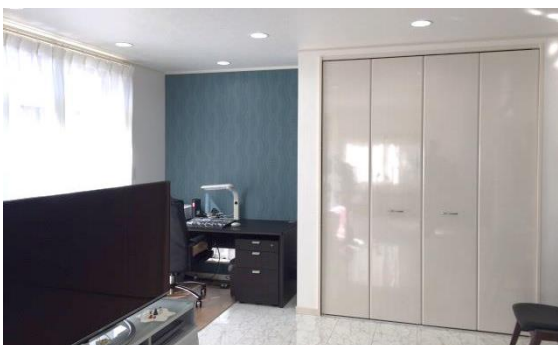
リビングは高級感のある明るい大理石調フローリングと間接照明

かなえ代表とは長い付き合いになりますが、一度だけ他店に浮気したことがあるそうです。「職人さんにも上手下手があることを知りました。営業の方が男性目線で、主婦としての要望が伝わらない、提案が無かったんです。何もかもがかなえハウスさんとは違って驚きました。丁寧で信頼できる会社があることは安心だし幸運なことですね。浮気をして初めてわかりました(笑)」これからも自分らしく楽しく暮らしていただきたいですね。