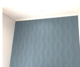
上:書斎スペースの壁紙はシックで上品なブルー。お部屋のアクセントになっています