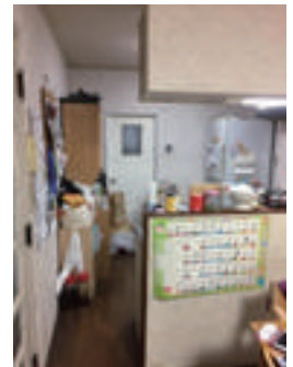
通路が狭く閉鎖的で使いにくかったキッチン

以前はL型の対面型キッチンで独立した形になっていました。リビングからの視線が遮られる為いつしか物が溢れ、調理中に家族が物を取りに来ると「じゃまだなあ・・・」と感じられました。新しいキッチンは作業スペースが広がったので、家族みんなでゆったり使えるようになりました。「娘が喜んでお手伝いしてくれるようになったんです！」と嬉しそうな奥様。