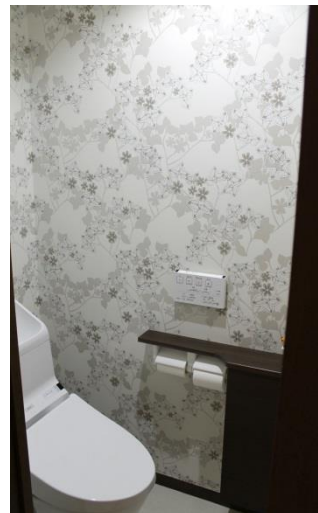
トレンドのスモーキーカラーボタニカルな壁紙でオシャレに