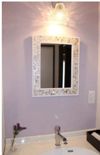
パウダールームには女性らしさをアップさせるラベンダー色